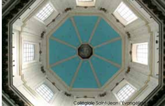
Collégiale Saint-Jean l'Évangéliste